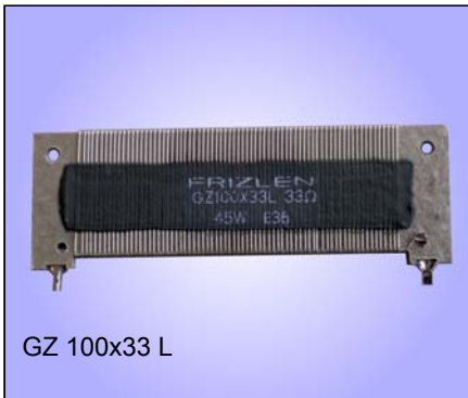
GZ 100x33 L

5 – 300 W, IP 00, Anschluss an Litzen oder Lötpins